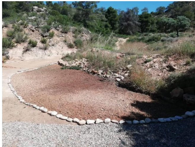
Moestuin idee, naar boerininspanje.nl